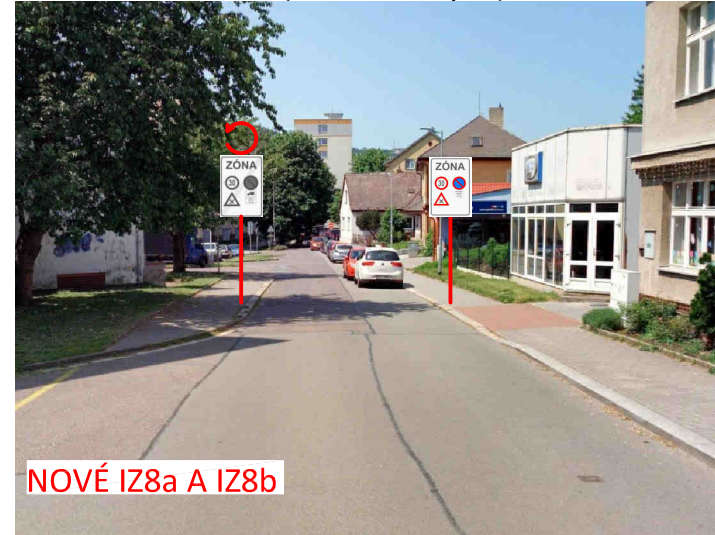
NOVÉ IZ8a A IZ8b

Revize B 08/2024 Úprava po projednání záměru v radě města Revize A 08/2024 Původní verze