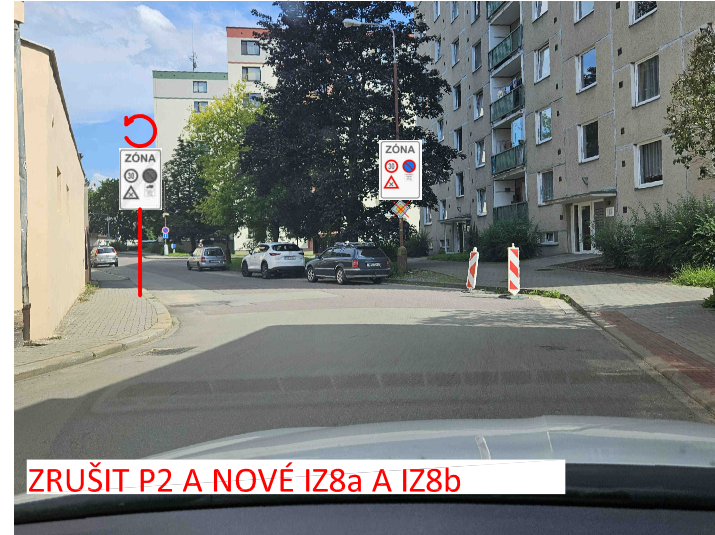
ZRUŠIT P2 A NOVÉ IZ8a A IZ8b