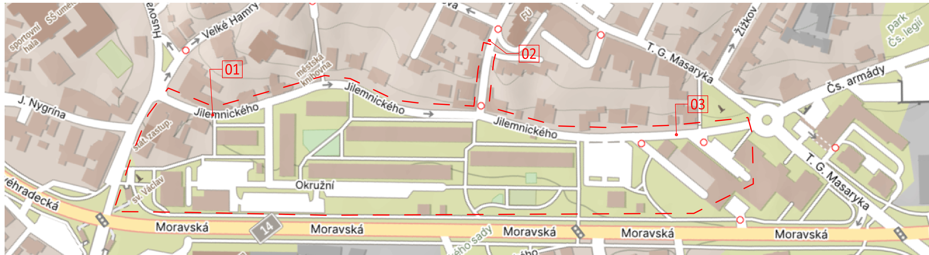
01 – Jilemnického (Husova)