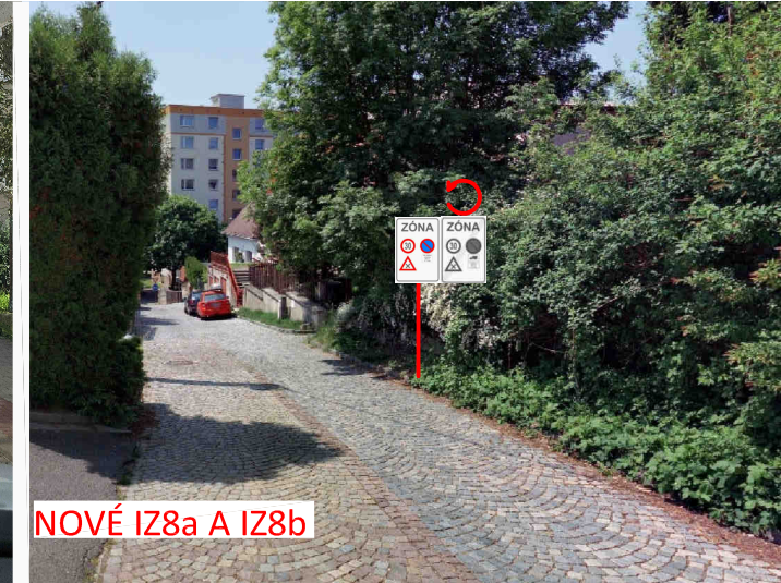
NOVÉ IZ8a A IZ8b