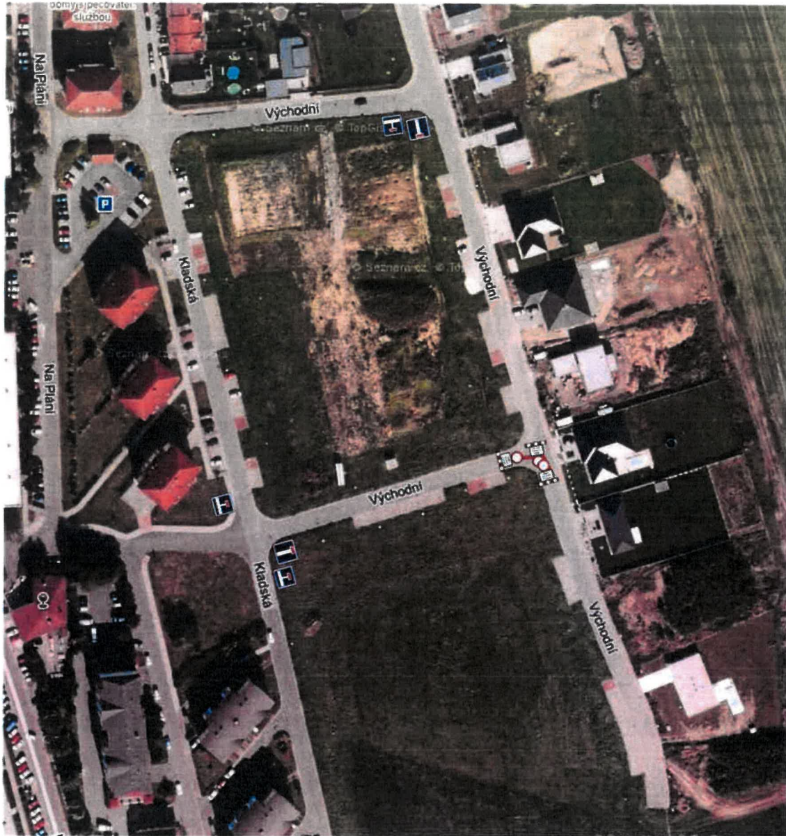
Přístup k nemovitostem v koordinaci se stavbou.