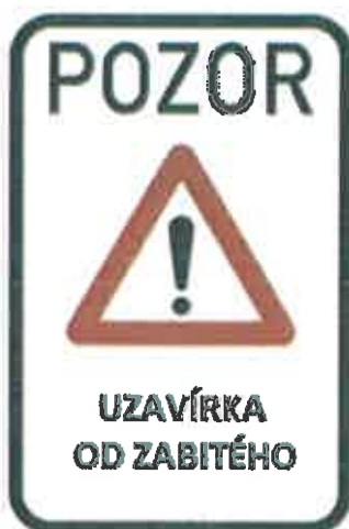
Změna místní úpravy IP22