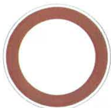
Zákaz vjezdu všech vozidel (v obou směrech) B01