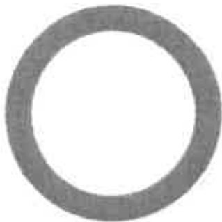
Zákaz vjezdu všech vozidel (v obou směrech) B01