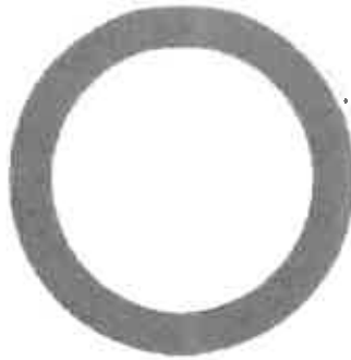
Zákaz vjezdu všech vozidel (v obou směrech) B01