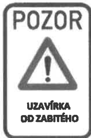
Značka místní úpravy IP22