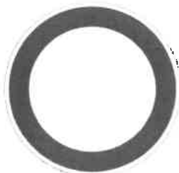
Zákaz vjezdu všech vozidel(v obou směrech) B01