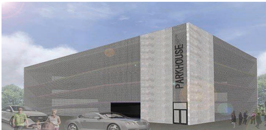
Parkovací dům – vizualizace