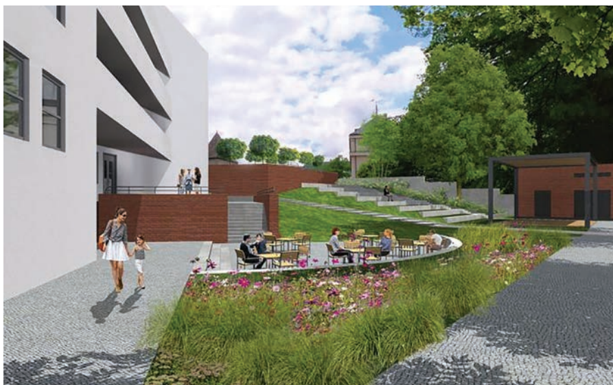
Park u divadla - vizualizace