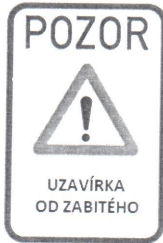
Změna místní úpravy IP22