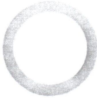
Zákaz vjezdu všech vozidel (v obou směrech) B01