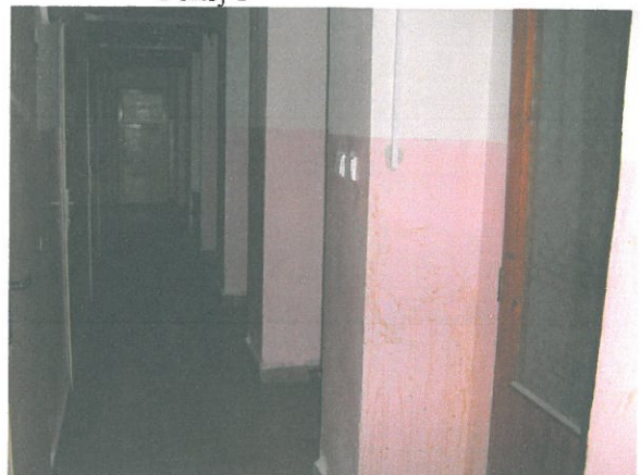
Suterén domu se sklepy