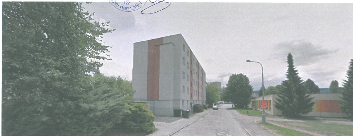
Bratři Čapku 1168 - 1169