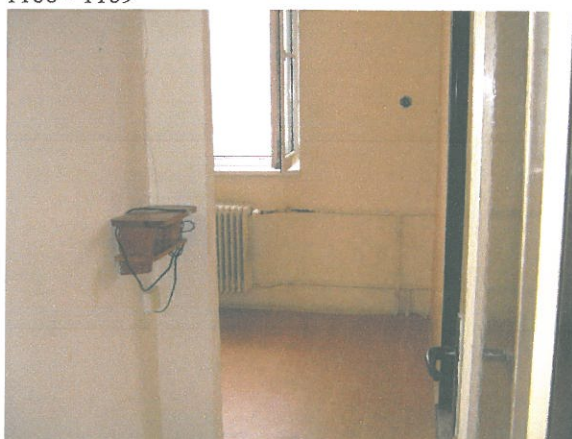
Vstup do kuchyně