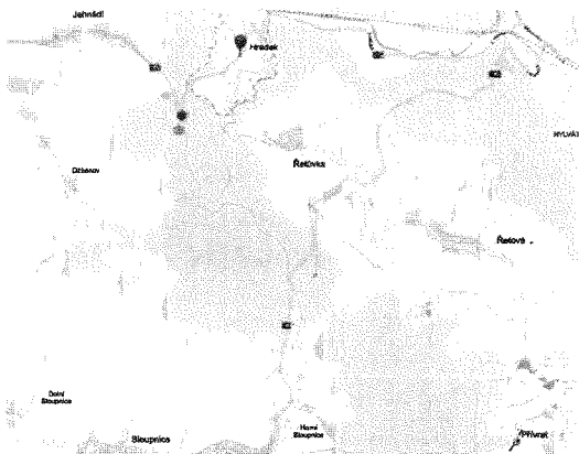
Umístění SDZ na silnicích II/315 a III/36016.