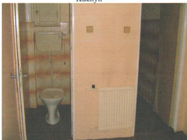
Chodba, WC, koupelna