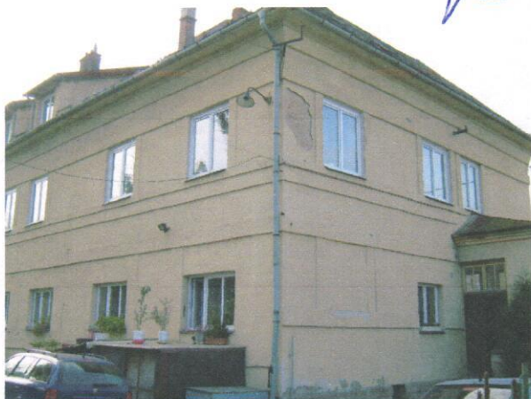
Bytový dům Hřbitovní 756