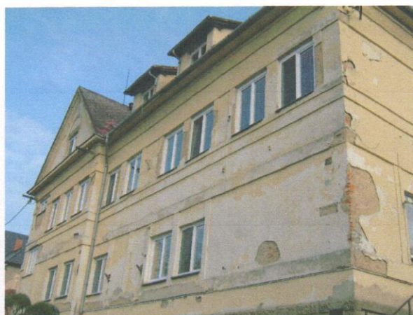
Bytový dům Hřbitovní 756