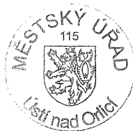
Bc. Radomíra Hájková vedoucí kanceláře tajemníka

Proti tomuto rozhodnutí se mohou ostatní volební strany, které kandidátní listinu podaly, domáhat do 2 pracovních dnů od jeho doručení ochrany u Krajského soudu v Hradci Králové, pobočka Pardubice (§ 59 odst. 2 zákona o volbách; za doručené se rozhodnutí považuje podle ustanovení § 23 odst. 4 zákona o volbách třetím dnem ode dne jeho vyvěšení na úřední desce obecního úřadu, který rozhodnutí vydal).