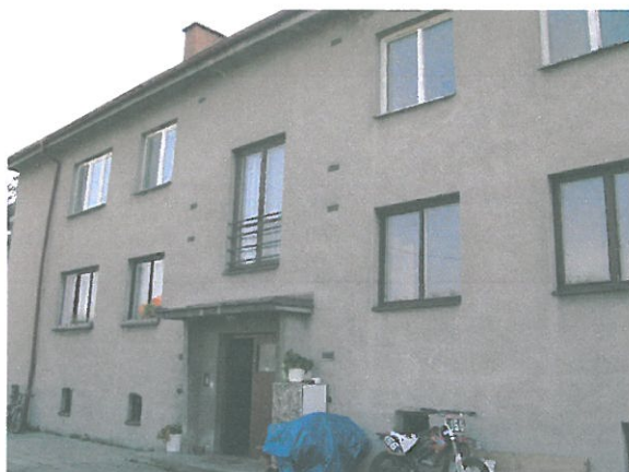
Bytový dům Knapovec 6