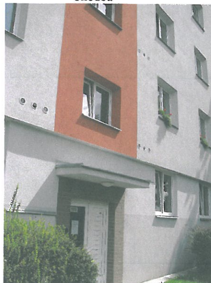
Bratři Čapků 1169