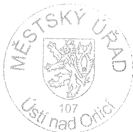
Ing. Jiří Zális

Proti tomuto rozhodnutí se lze odvolat ve lhůtě 15 dnů ode dne jeho oznámení ke Krajskému úřadu Pardubického kraje, podáním učiněným u Městského úřadu Ústí nad Orlicí. Odvolání musí mít potřebné náležitosti ( viz ustanovení § 37 odst. 2 zákona č. 500/2004 Sb., správní řád ) a musí obsahovat údaje o tom, proti kterému rozhodnutí směřuje, v jakém rozsahu ho napadá a v čem je spatřován rozpor s právními předpisy nebo nesprávnost rozhodnutí nebo řízení, jež mu předcházelo. Odvolání jen proti odůvodnění rozhodnutí je nepřípustné. Odvolání se podává s potřebným počtem stejnopisů tak, aby jeden stejnopis zůstal správnímu orgánu a aby každý účastník dostal jeden stejnopis. Nepodá-li účastník potřebný počet stejnopisů, vyhotoví je správní orgán na náklady účastníka.