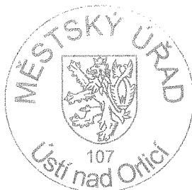
Ing. David Soukal vedoucí odboru životního prostředí

Proti tomuto usnesení může účastník řízení podat podle ustanovení § 76 odst. 5 správního řádu odvolání, ve kterém se uvede v jakém rozsahu se usnesení napadá, ve lhůtě 15-ti dnů ode dne jeho oznámení ke Krajskému úřadu Pardubického kraje, podáním učiněným u Městského úřadu Ústí nad Orlicí. Odvolání se podává v potřebném počtu stejnopisů, tak aby jeden stejnopis zůstal správnímu orgánu a aby každý účastník dostal jeden stejnopis. Nepodá-li účastník potřebný počet stejnopisů, vyhotoví je na jeho náklady Městský úřad Ústí nad Orlicí. Podané odvolání nemá v souladu s ustanovením § 76 odst. 5 správního řádu odkladný účinek. Odvolání jen proti odůvodnění je nepřipustné.