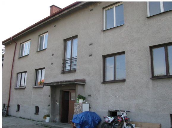
Bytový dům Knapovec čp. 6

VYVĚŠENO: 10.11.2011 SVĚŠENO: 19.01.2012