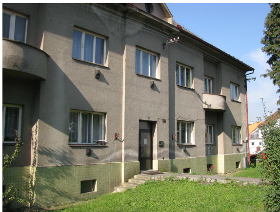
Bytový dům Husova 693