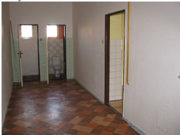
Chodba, spíž a WC