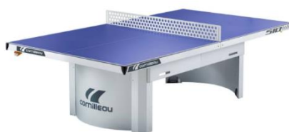
Venkovní stůl na ping-pong