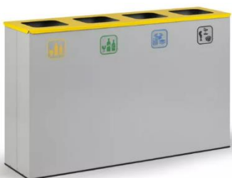
Odpadkový koš na tříděný odpad