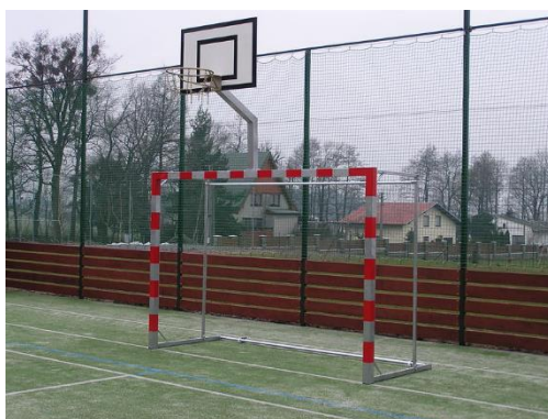
Basketbalový koš s bránou