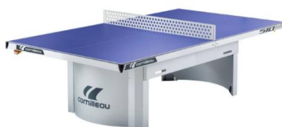
Venkovní stůl na ping-pong