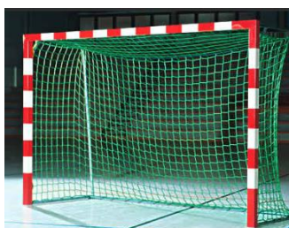
Síť na bránu